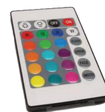
Control RGB Key remote